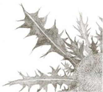
C I C A D E